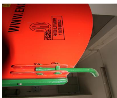
Sasiu retaiat si sigurante in spate