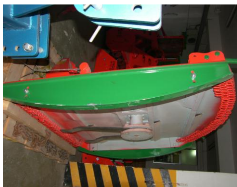
Sistem de patine