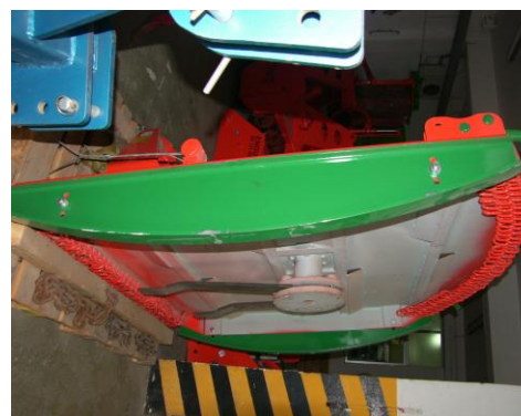
Patine reglabile a inatimii