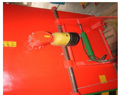
Desplasare laterală hidraulic