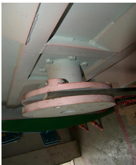
Sistem de schimb al sculelor