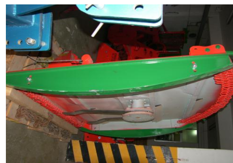
Sistem de patine