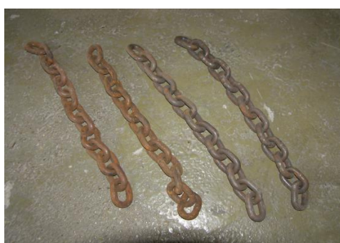
Tip de lanturi intercambiabile