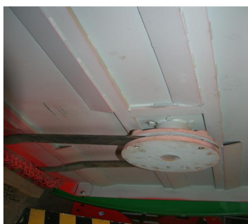
Sistem de cutite sau lanturi